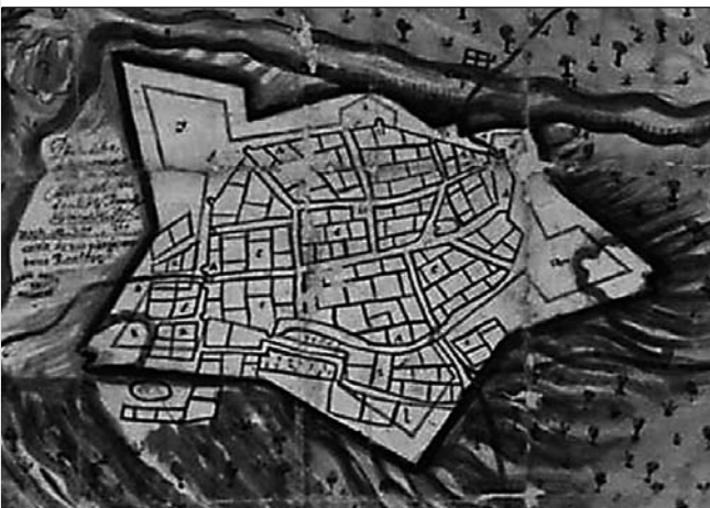
Planta de Traiguera. Pedro Alexandre [1648]. Font: Cartoteca de l'Arxiu General Militar. Còpia

Les primeres esglésies que s'edifiquen per difondre una nova fe davant l'islam són d'estil romànic i gòtic, caracteritzades pels arcs diafragma i denominades de reconquesta. Algunes esglésies i campanars medievals es construeixen amb elements defensius per protegir la població o com a torre de guaita, com passa a Xert, Rossell, Càlig o Canet lo Roig. El fervor religiós dels segles XVII i XVIII es plasma en les grans reformes efectuades a les esglésies d'estil gòtic o de nova planta, en molts casos mitjançant el manteniment