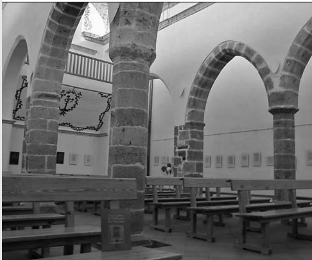
Llotja medieval, actual ermita de Sant Sebastià de Cervera. Autor: Casto Sorlí

Pel que fa a l'arquitectura civil, destaquen les construccions dels segles XIV i XV amb carreus treballats, portalades amb arcs de mig punt i sovint finestrals dobles rematats amb arcs trilobulats. No es generalitza la rajola fins al segle XVIII. També podem trobar escuts nobiliaris amb iconografia montesiana, inquisitorials o del llinatge dels Caperó. Als segles XVI i XVII, apareixen palaus renaixentistes d'influència italiana, però impera encara la tradició gòtica tardana. Entre els més representatius de l'arquitectura nobiliària, destaca el palau dels Vilanova, el palau dels Villosos o el palau dels Mestres (Sant Mateu), el palau de Pestagua (Xert), Cal Racó (Sant Jordi), la casa dels Caperó (Traiguera), el palau dels Jovaní o la casa dels Borrull (la Jana). Alguns ja han desaparegut, com la casa Borrull (Cervera), el palau dels Vallterra (Càlig) o el palau dels Piquers (Canet lo Roig). També són destacables les cases del consell, com la de Traiguera o la Cort Nova de Sant Mateu.