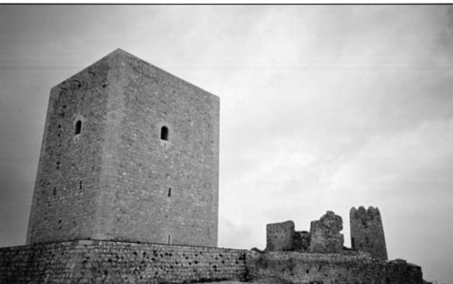
Castell hospitaler d'Uldecona. Torre quadrada (segle XIII).