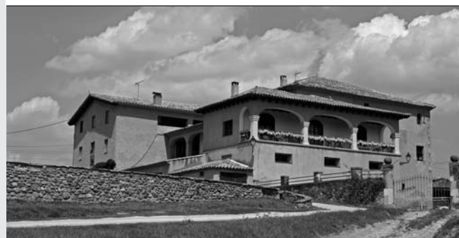
El mas El Colomer de Taradell.

La seu de l'Ecomuseu del Blat, i alhora centre d'acollida i distribució de visitants, és a la Cabanya de la Roca, una cabanya d'era ubicada al costat de la col·lecció de carros de l'Al-