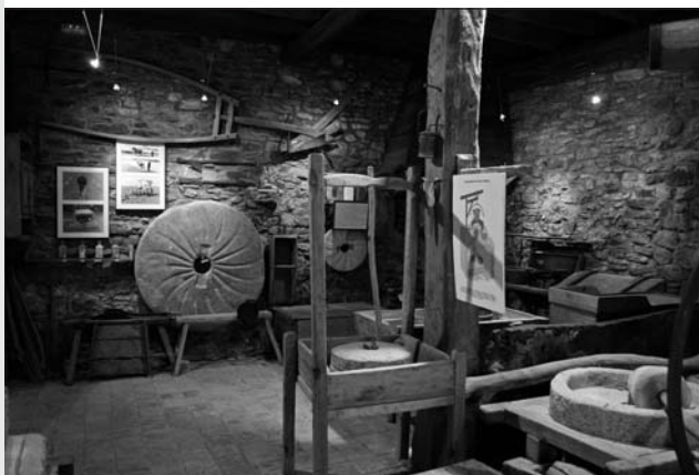
Obrador del molí de la Calvaria de Calldetenes.

La Casa Museu Verdaguer de Folgueroles vol mostrar la casa d'un pagès del carrer major. Forma part de la casa familiar on el poeta romàntic Jacint Verdaguer (1845-1902) va residir els primers anys de vida. A banda d'aspectes biogràfics del poeta, s'hi reproduïxen elements de la vida quotidiana d'un poble de la plana de Vic. La Casa Museu Verdaguer és també la història de moltes famílies del poble de Folgueroles, situat a cavall de la plana i les Guillerries, que practicaven la pluriactivitat: els homes eren parcers i assalariats que treballaven camps dels grans masos del municipi, i feien de picapedrers, traginers o bosquerols a temps parcial, mentre les dones cuidaven el porc i l'aviram i moltes d'elles, nenes incloses, formaven part de l'estol de fabricantes que cada dia anaven a peu a treballar a les indústries tèxtils del Ter.