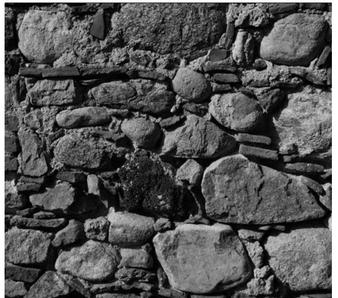
Figura 2: Tancament de pedra al Baix Empordà.

Per tant, és un clar exemple de complexitat amagada al darrere d'una frase amb la intenció d'evitar una discordança visual. La normativa es presenta ambigua en la definició de la pedra del lloc i també aliena a la complicació que suposa obtenir, pels circuits convencionals de distribució, pedres d'origens tan diferents de les que avui dia estan en circulació. Això es pot complicar més encara si la intervenció planteja una ampliació que exigeix més quantitat d'aquesta pedra. Altres condicions d'edificacions que apareixen en molts catàlegs són: «Els colors de les façanes han de ser semblants als existents en el sector, amb un predomini absolut d'un color o material sobre tots els altres», o bé «En tot cas s'acabaran amb morter acolorit o pintures de color terrós». La cura dels materials que caldrà aplicar es defineix princi-