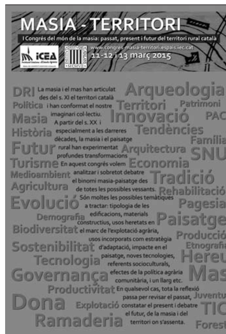
Cartell del I Congrés del món de la masia.

Per aquest motiu, aquest congrés ha estat preparat per professionals relacionats amb el món rural que formen part d'institucions o entitats on es troben tant la multidisciplinarietat com la integració: CATS de la UdG, ETSAB de la UPC, Unió de Pagesos, ESG Vila Nova de Cerveira, Universitat de Vic-Universitat Central de Catalunya, ICEA, UAB, UB, ESAB de la UPC, AMTE, AADIPA del COAC, Departament de Cultura, SCOT de l'IEC, CDCA de Solsona, i Departament de Territori i Sostenibilitat. Tindrà lloc els dies 11, 12 i 13 de març de 2015, a la seu de l'Institut d'Estudis Catalans (carrer del Carme, 47, Barcelona). ■