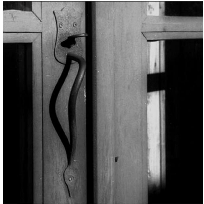
Figura 3: Exemple de fusteria tradicional.

trucció i una aconseguida indispensabilitat. Els preceptes de maximització de l'eficàcia de la modernitat han donat pas amb força a una construcció estandarditzada on no hi ha lloc per a casos particulars, com exigeix la rehabilitació de les arquitectures locals. Això genera una contradicció dels principis funcionals constructius del patrimoni vernacle, perquè la lògica contractual del rendiment respecte a fins obliga a solucions estandarditzades i desvinculades del territori, tant físic com cultural. Però conscient d'aquest desancoratge, l'Administració, mitjançant l'eina de la legislació, promou un reconeixement creixent de la diversitat cultural local basat en les variables més visuals. El resultat és un patró confús de desconeixement i reconeixement de les lògiques culturals. ■