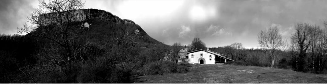
Figura 1: Paisatge rural de Collsacabra

mitjançant el text refós de la Llei d'urbanisme de Catalunya de 2005 (TRLUC), i més concretament les figures del catàleg de masies o el PEM, en cas que el municipi en qüestió en disposi.