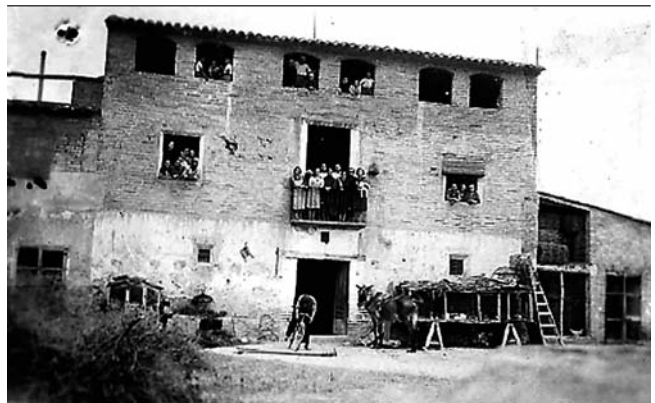
Mas de Manou, a Móra la Nova.

D'altres van rebre pressions de l'Administració, que prioritzava l'activitat forestal enfront de la ramadera en els territoris de la seva jurisdicció, i també van acabar marxant. Es tracta d'un fenomen comú a la zona dels Ports de Beseit, a la Tinença de Benifassà i als ports de Morella.