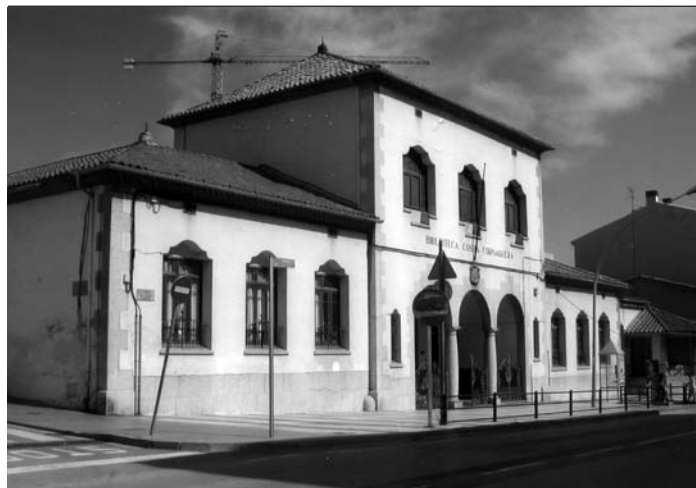
Biblioteca Costa Fornaguera de Calella. Projecte de l'arquitecte Jeroni Martorell.

En qualsevol cas, aquest monogràfic de Plecs vol posar en relleu, sense ànim de ser exhaustius, la importància del tema des de la perspectiva de la història social de les professions liberals. Sense desatendre, però, l'anàlisi formal del llenguatge arquitectònic polièdric utilitzat pels arquitectes que treballaren per a les administracions públiques, que anirà des dels historicismes d'arrel vuitcentista al racionalisme, passant pel modernisme i el noucentisme. ■