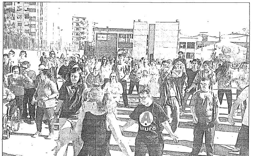
Los alumnos compartieron con los invitados diferentes actividades y juegos en el patio.

Con este misterio y enigma nocturno, el Espai Jove Kesse supera ya la cifra de más de 120 enigmas realizados desde el pasado año 2008 y asienta cada vez más su intencionalidad lúdica y educativa sobre un campo de alternativas de ocio y también de consumo.