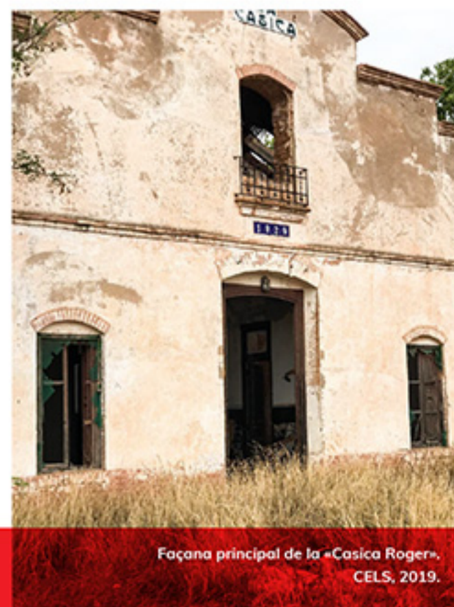
Façana principal de la «Casica Roger». CELS, 2019.