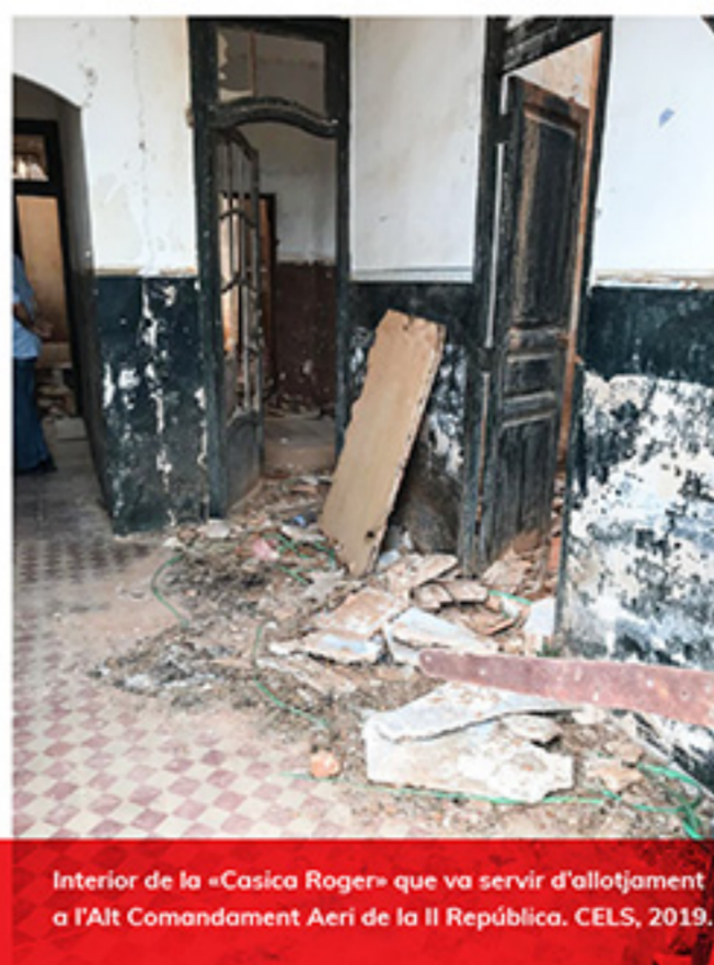
Interior de la «Casica Roger» que va servir d'allotjament a l'Alt Comandament Aeri de la II República. CELS, 2019.

Aquest aeròdrom formava part d'un conjunt d'aeròdroms militars que configuraven un arc de protecció de la ciutat de València i nodrien la 4a Regió Aèria Governamental, que també disposava de camps d'aviació a Conca, Terol, Alacant, Castelló de la Plana i València. Inicialment, l'aeròdrom tenia el codi 423 (4a Regió Aèria, 2n Sector; 3r Camp).