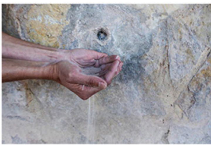
Evidència de l'estat en què es troben les canonades seques de la Fuente Raimundo. CELS, 2019

El conjunt patrimonial inclou la font rajadora amb quatre canonades i un espai d'emmagatzemament de les aigües provinents de les capes freàtiques. Aquest espai es troba cobert per un rafal que requereix una actuació recuperadora. Pels voltants, hi ha bancades corregudes i una terrassa que recau sobre la Rambla Castellarda, a manera de mirador. L'actual estat de conservació és molt deficient.