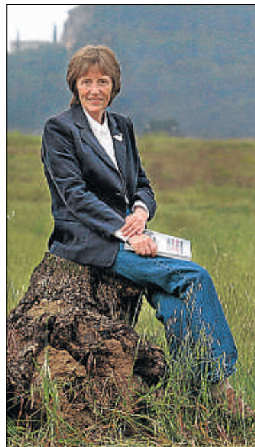
EDICIONES SAN JUAN DE DIOS

Vostè va elaborar una tesi sobre les dones britàniques a la Guerra Civil espanyola. Sí, quan em vaig adonar que nin-